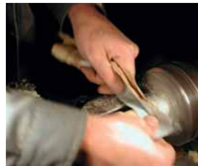
ALTE KLARINETTEN IM NETZ: WWW.TUTZ.AT