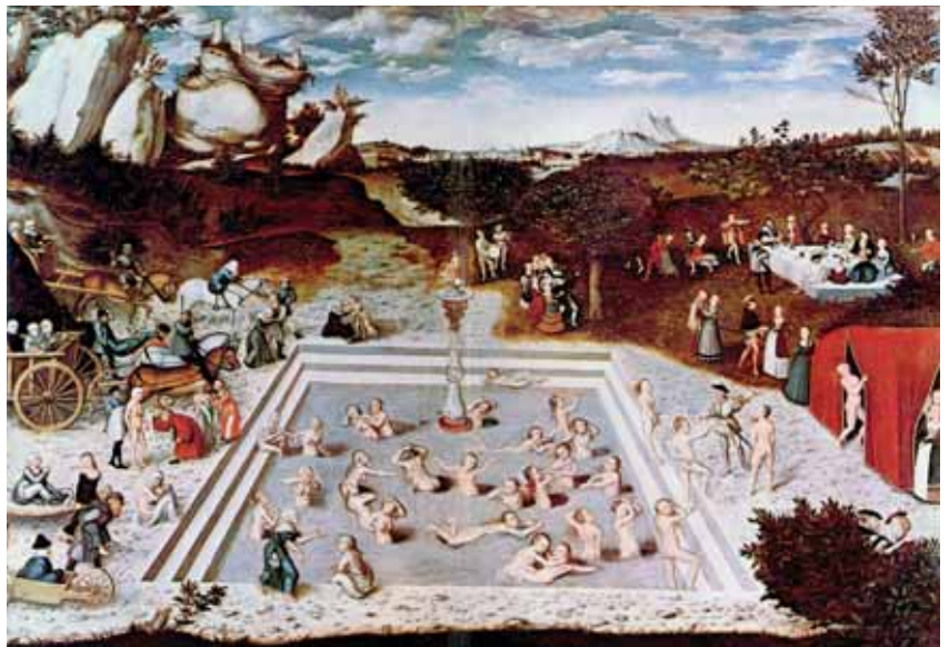
DER JUNGBRUNNEN IN DER FANTASIE VON LUCAS CRANACH (1546).