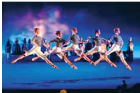
SZENEN AUS ZÜRICHER CHOREOGRAPHIEN VON HEINZ SPOERLI, LINKS: FÜNF TÄNZER AUS „LES INDES GALANTES“.